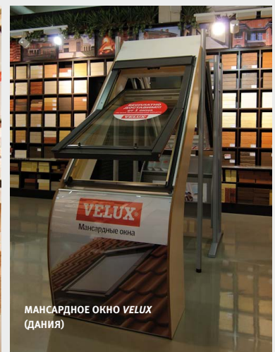
МАНСАРДНОЕ ОКНО VELUX (ДАНИЯ)