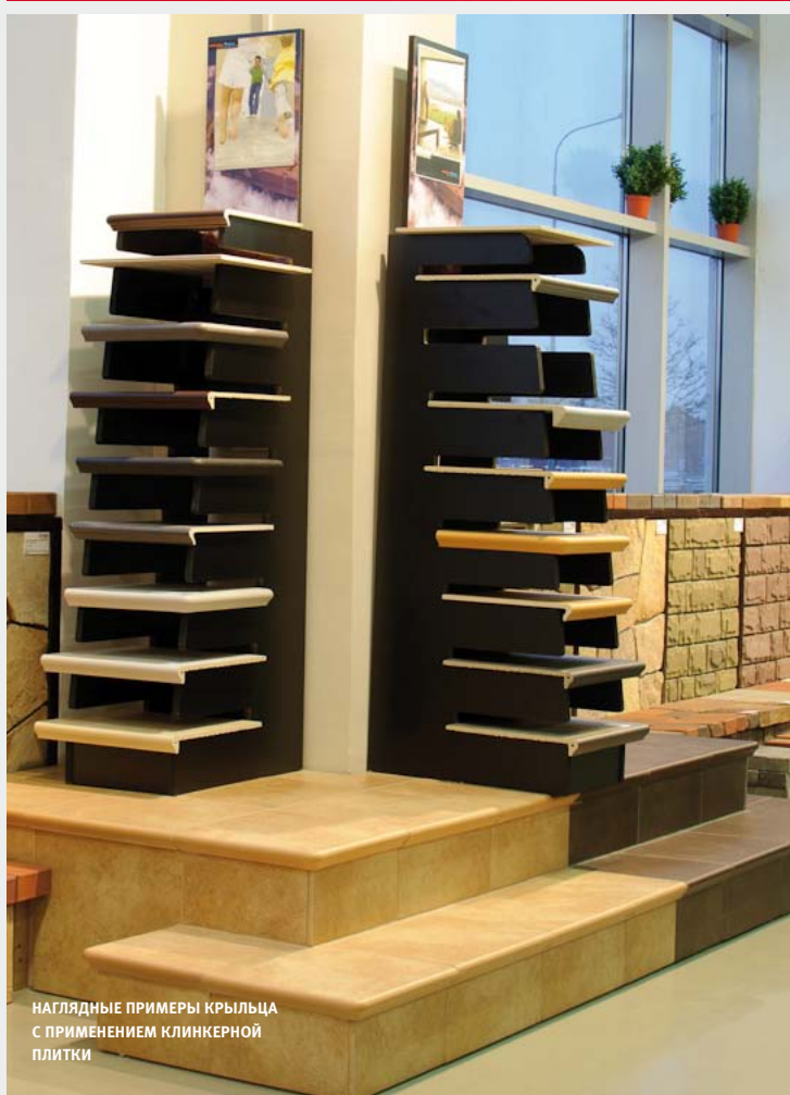
НАГЛЯДНЫЕ ПРИМЕРЫ КРЫЛЬЦА С ПРИМЕНЕНИЕМ КЛИНКЕРНОЙ ПЛИТКИ