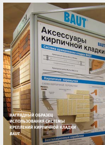
НАГЛЯДНЫЙ ОБРАЗЕЦ ИСПОЛЬЗОВАНИЯ СИСТЕМЫ КРЕПЛЕНИЙ КИРПИЧНОЙ КЛАДКИ BAUT