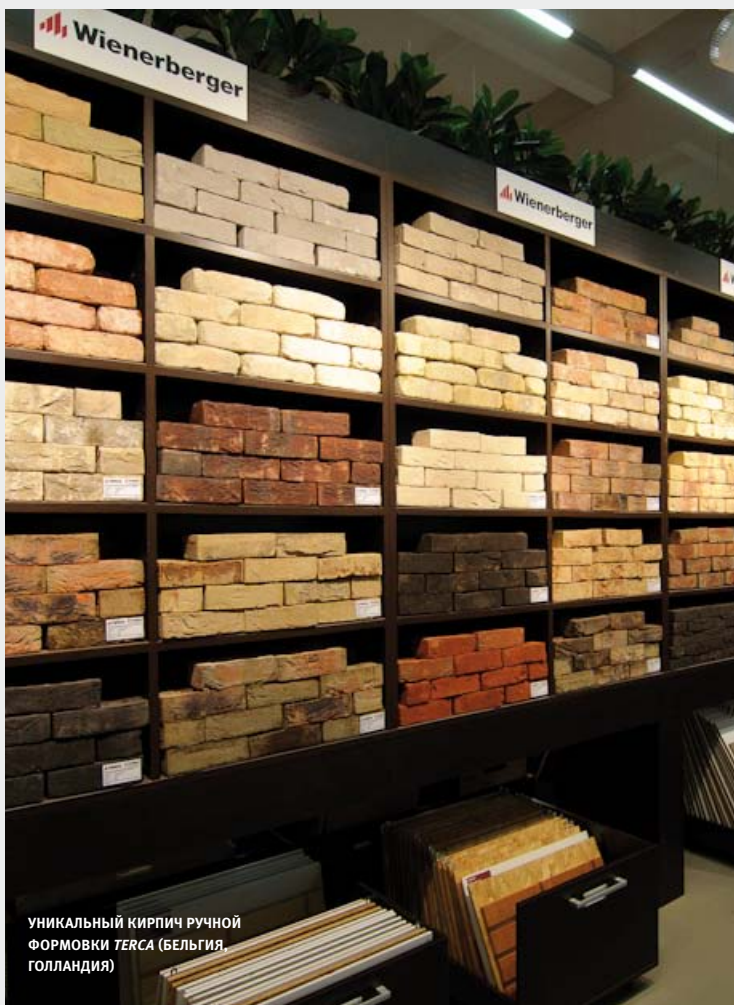
УНИКАЛЬНЫЙ КИРПИЧ РУЧНОЙ ФОРМОВКИ TERCA (БЕЛЬГИЯ, ГОЛЛАНДИЯ)