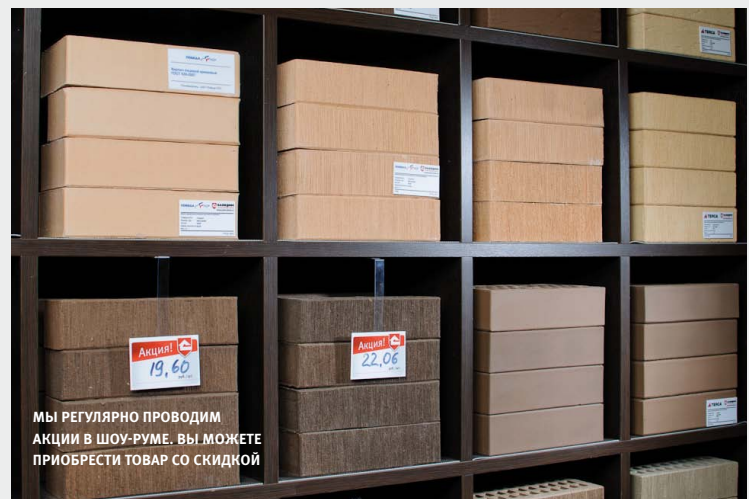
МЫ РЕГУЛЯРНО ПРОВОДИМ АКЦИИ В ШОУ-РУМЕ. ВЫ МОЖЕТЕ ПРИБРЕСТИ ТОВАР СО СКИДКОЙ