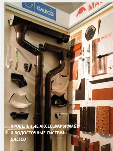
КРОВЕЛЬНЫЕ АКСЕССУАРЫ МАБЕ И ВОДОСТОЧНЫЕ СИСТЕМЫ GALECO