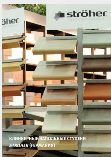
КЛИНКЕРНЫЕ ПОЛОЖЬНЫЕ СТУПЕНИ STROEHER (ГЕРМАНИЯ)