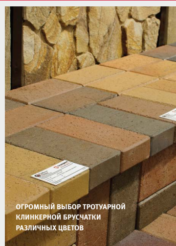
ОГРОМНЫЙ ВЫБОР ТРОТУАРНОЙ КЛИНКЕРНОЙ БРУСЧАТКИ РАЗЛИЧНЫХ ЦВЕТОВ