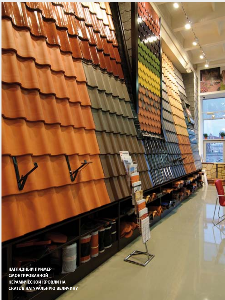
НАГЛЯДНЫЙ ПРИМЕР СМОНТИРОВАННОЙ КЕРАМИЧЕСКОЙ КРОВЛИ НА СКАТЕ В НАТУРАЛЬНУЮ ВЕЛИЧИНУ