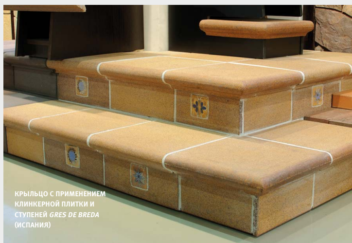
КРЫЛЬЦО С ПРИМЕНЕНИЕМ КЛИНКЕРНОЙ ПЛИТКИ И СТУПЕНЕЙ GRES DE BREDA (ИСПАНИЯ)