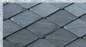
Вид укладки: RHOMBUSDECKUNG Тип плитки: RHOMBUS, ECOSTAR