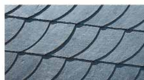
Вид укладки: SCHUPPENDECKUNG Тип плитки: SCHUPPEN