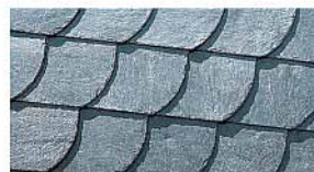
Вид укладки: BOGENSCHNITTDECKUNG Тип плитки: BOGENSCHNITT, WABEN, UNIVERSAL