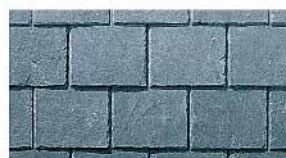
Вид укладки: RECHTECKDECKUNG Тип плитки: RECHTECK