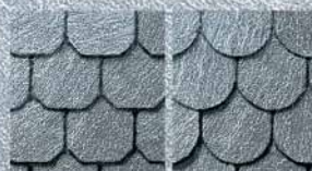
Вид укладки: DEKORATIVEDECKUNG Тип плитки: OCTOGONES, COQUETTES